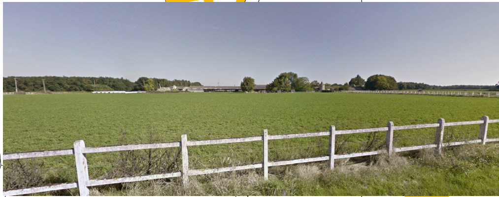
Photo 1 - PC8 - Paysage lointain